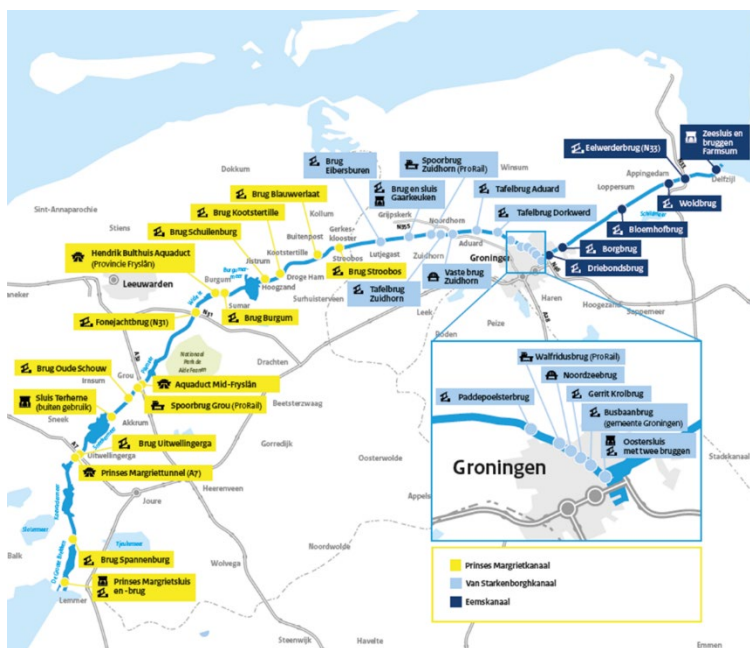
Afbeelding 1 Overzicht van bruggen, aquaducten en sluizen op de HLD

Het Rijk is eigenaar van de HLD en Rijkswaterstaat (RWS) beheert en onderhoudt de HLD. De HLD is een CEMT klasse Va vaarweg. De bak en de kunstwerken voldoen nog niet allemaal aan de eisen van de klasse Va vaarweg. Daarom is Rijkswaterstaat met een aanlegprogramma gestart waarin ook brug Kootstertille is opgenomen.