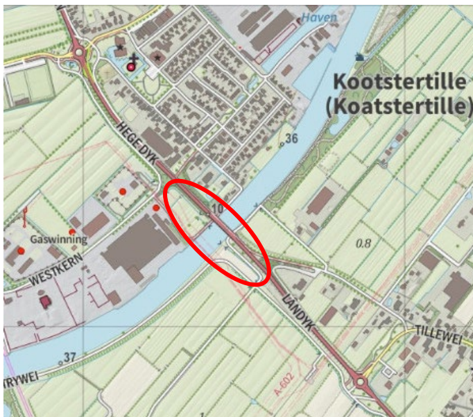
Figuur 1 Projectgebied verkenning Kootstertille

De rode cirkel in figuur 2 geeft een indicatie van het studiegebied. Dit studiegebied houdt in dat voor elk alternatief voor de oeververbinding Kootstertille kansen en gevolgen voor brug Schuilenburg in kaart wordt gebracht. Daarom is Schuilenburg opgenomen in het studiegebied en worden daarbij ook de effecten op verkeersnetwerk en sociaaleconomische effecten beschouwd.