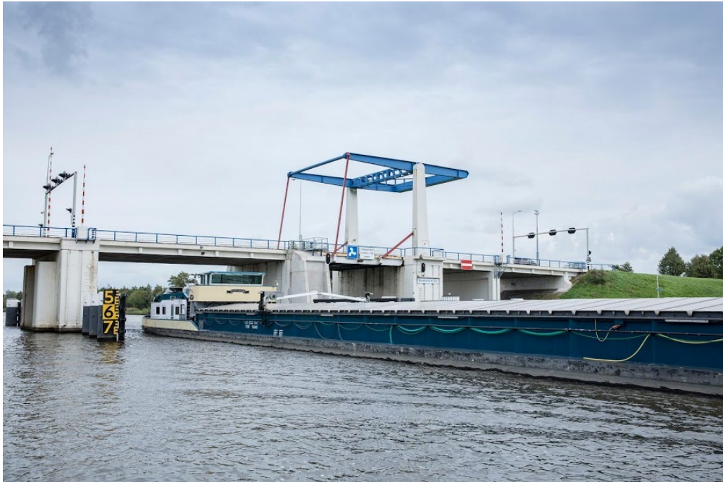
Afbeelding 2 Huidige brug Kootstertille